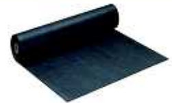
CF フレックスフィルターA 2000mm*100m