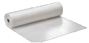
CF フレックスシートDK 1500mm*50m