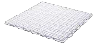
CF フレックスマットM30 1000*1000*H29mm