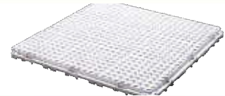
CF フレックスマットM55 1000*1000*H55mm