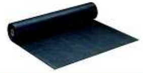
CFフレックスフィルターA 2.0m×100m t=1.0