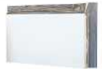
CFフレックスパネル 1995*995*50mm