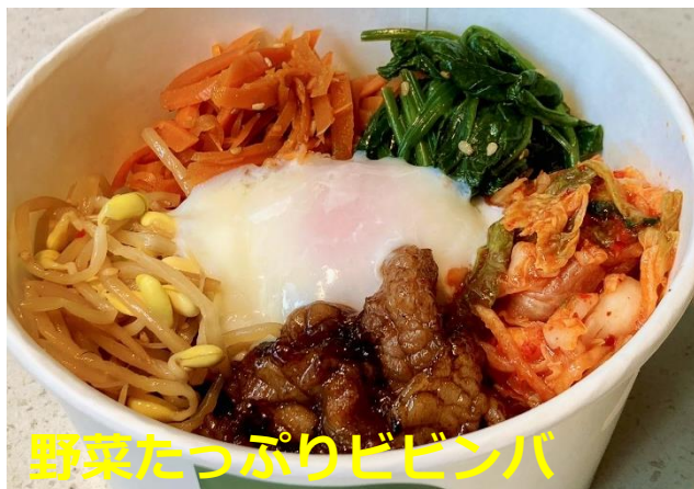
野菜たっぷりビビンバ