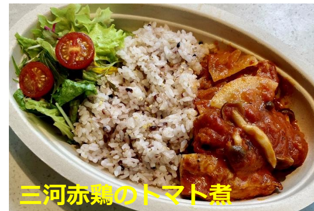
三河赤鶏のトマト煮

全品：990円（税込）、 お支払いは「アプリオーダー決済」のみとなります。 「アプリオーダー決済」のフローは別紙をご参照ください。