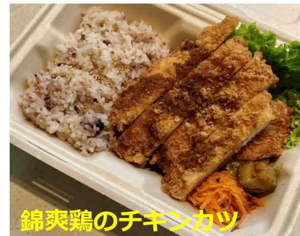
錦爽鶏のチキンカツ