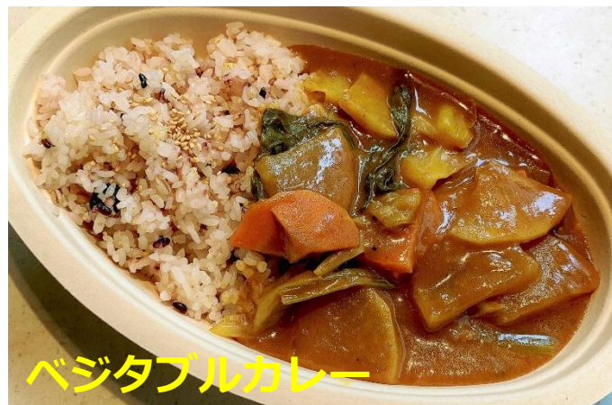
ベジタブルカレー