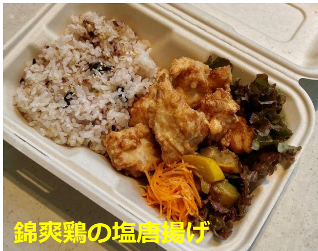
錦爽鶏の塩唐揚げ